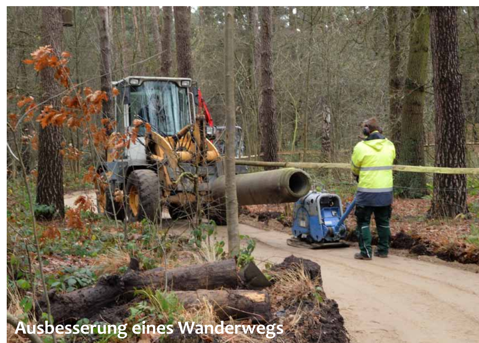
Ausbesserung eines Wanderwegs

In den 6,5 Jahren Laufzeit fanden regelmäßig Exkursionen und Infoveranstaltungen für die Öffentlichkeit statt, um die einzelnen Handlungen im Vorfeld oder aber nach erfolgreicher Umsetzung vorzustellen. Die Projekt-Homepage www.life-eichenwaelder.de und der Newsletter „Der Waldbote“ ermöglichten zudem einen ausführlichen Blick auf das aktuelle Geschehen im Life-Projekt. Naturerlebnistafeln, die in vier Projektgebieten aufgestellt worden sind, informieren die Besucher über die Vielfalt der Natur direkt vor Ort.