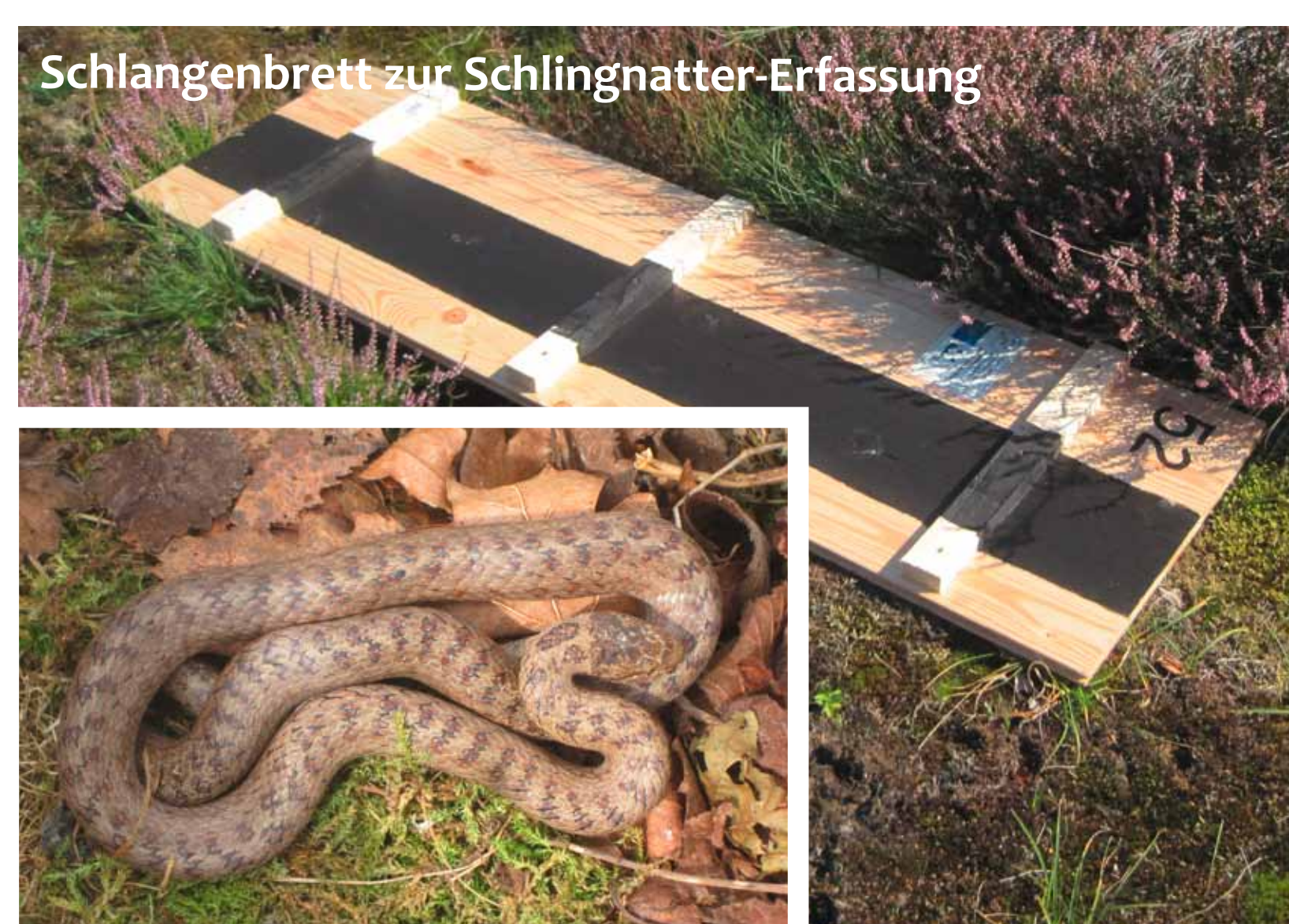
Schlangens Brett zur Schlingnatter-Erfassung