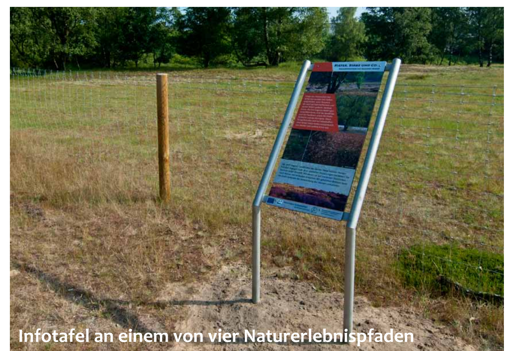
Infotafel an einem von vier Naturerlebnispfaden

Des Weiteren wurde während des Projektes eine Effizienzkontrolle durchgeführt. Hierfür erfolgte die Zählung der Zielarten wie Schlingnatter und Moorfrosch vor sowie mehrmals nach der Umsetzung der Maßnahmen. So konnte bestätigt werden, dass die Arbeiten im Projekt einen direkten, positiven Einfluss auf die gefährdeten Arten haben.