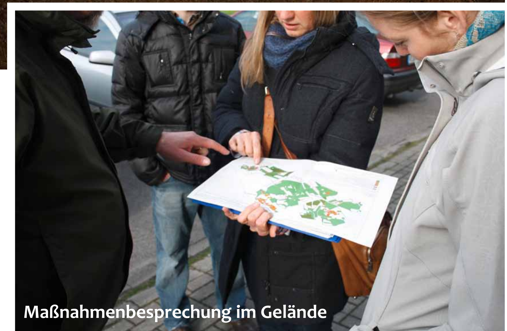
Maßnahmenbesprechung im Gelände

Insgesamt wurden 36 Handlungen im Life+-Projekt umgesetzt. Neben 16 Naturschutzmaßnahmen, die zur Förderung der bedrohten Lebensräume, Tier- und Pflanzenarten direkt im Gelände umgesetzt wurden, gab es noch eine Reihe weiterer Aufgaben: Beispielsweise wurden zur Vorbereitung Gutachten zum Wasserhaushalt der Moore und Heide in Auftrag gegeben. Zur dauerhaften Sicherung der wertvollen Lebensräume für den Naturschutz, konnten zudem insgesamt 125 Hektar im Projektgebiet erworben sowie 30 Hektar längerfristig gepachtet werden.