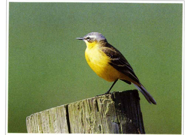
Abb. 4: Schafstelze

Die Schafstelze ist im Orsoyer Rheinbogen noch regelmäßig anzutreffen. Sie brütet in den ungestörten Hochstaudenfluren des Rheinvorlands.