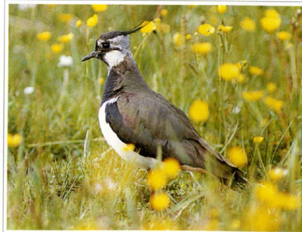
Abb. 3: Kiebitz

Der bundesweit stark zurückgehende Kiebitz brütet auf den extensiv genutzten Grünlandflächen des Orsoyer Rheinbogens.