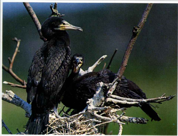
Abb. 1: Kormorane am Nest

Der Kormoran ist als Nahrungsgast regelmäßig an den Gewässern des Schutzgebietes zu beobachten. Als Brutvogel tritt er hier nur gelegentlich auf.