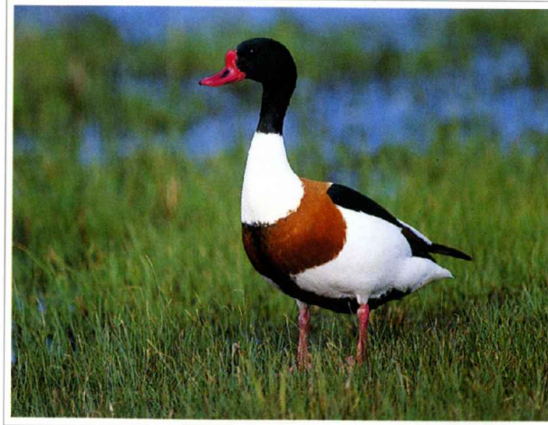
Abb. 2: Brandgans

Die Brandgans ist erst seit ca. 30 Jahren am Unteren Niederrhein zu beobachten. Sie zieht ihre Jungen auch im Orsoyer Rheinbogen auf.